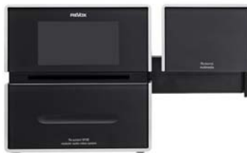
M100 Front mit einem Modul